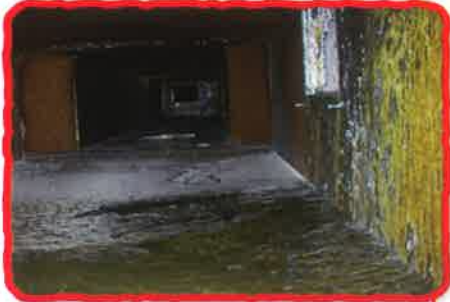
排気ダクト ●油塵の付着、油漏れなど