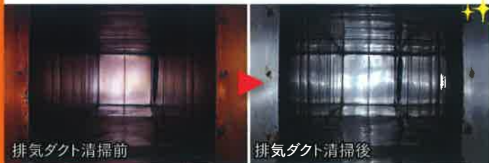
排気ダクト清掃前