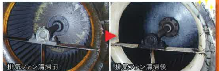
排気ファン清掃前