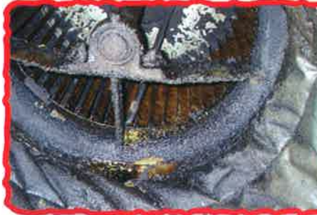
排気ファン ●羽根車、ケーシング ●異音、振動 ●Vベルトの劣化 など